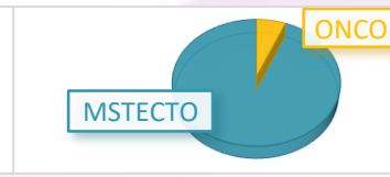
Figure 02 . répartition en fonction du geste chirurgical