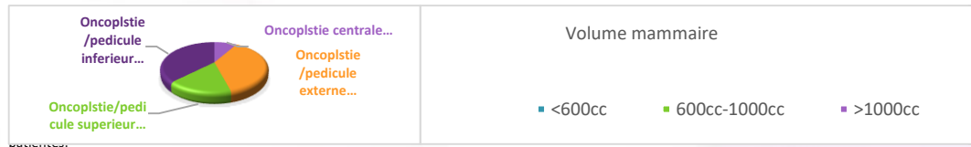
Figure 04. Répartition en fonction de la technique d'oncoplastie

Nos patientes ont fait l'objet de sélection regroupant plusieurs facteurs décisionnels indispensables à la décision chirurgicale, actuellement reconnus par les consensus et recommandations en vigueur [3-5]. Désir et motivation de la patiente pour le geste de conservation. Absence de contre indication à un traitement conservateur ; Patientes ne présentant pas de tumeur mammaire relevant d'une chimiothérapie adjuvante pour impossibilité de chirurgie première (T4a - T4c - T4d – N2 - N3- PEV Absence de contre indication à une radiothérapie postopératoire. La présence d'une composante intracanaulaire in situ (CIE ) supérieure à 25 %, car elle est identifiée comme un risque important de rechute locale. Absence de multicentricité et certaines multifocalité sur l'IRM mammaire. Volume mammaire satisfaisant : le ratio taille tumorale/volume sein (TT/VS) doit être compatible avec une conservation, il doit permettre la résection tumorale tout en permettant une reconstruction correcte du sein restant.