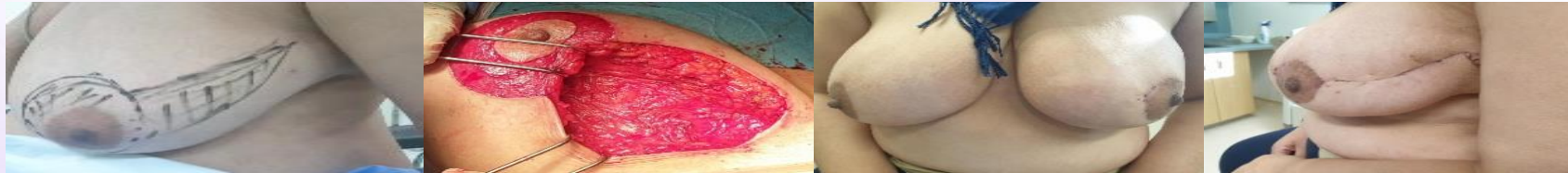
Figure 05. Oncoplastie par pédicule externe.

•L'évaluation des résultats esthétiques à distance de la chirurgie et de la radiothérapie faisait ressortir 03 groupes. Très satisfaisant-Relativement satisfaisant-Relativement peu satisfaisants Respectivement de 41,66%- 41,66%-16,66 %pour la Patiente et de 75%- 16,66%- 13,33% pour le chirurgien.