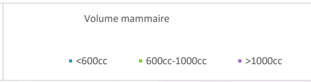
Figure 03. Répartition en fonction du volume mammaire