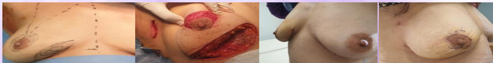
Figure 06. Oncoplastie par pédicule supérieur.